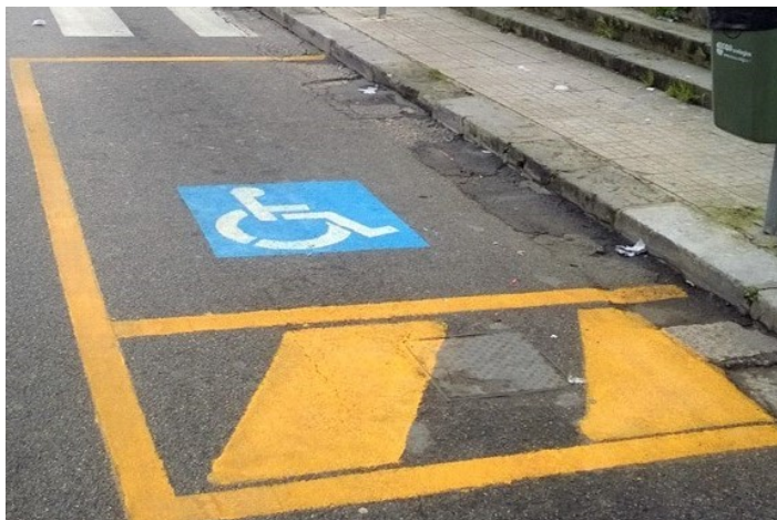
Nelle foto: sopra uno spazio riservato ai veicoli delle persone con disabilità; sotto le strisce blu a pagamento

Si aumenta la sicurezza dei pedoni che attraversano una strada priva di semafori, introducendo obblighi di cautela per gli automobilisti. In corrispondenza degli attraversamenti pedonali, chi è alla guida di veicoli è obbligato a dare la precedenza, rallentando o fermandosi, non solo ai pedoni che hanno iniziato l'attraversamento, ma anche a chi si accinge a farlo.