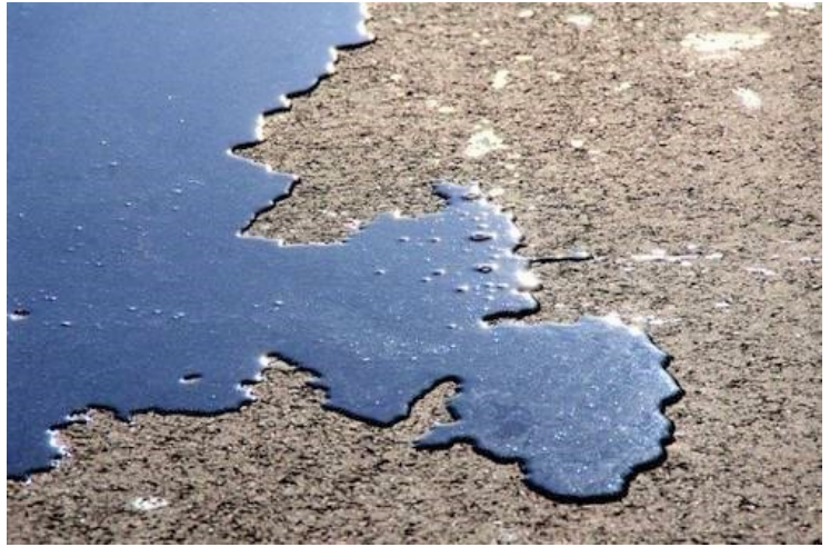
Nelle foto: sopra, una chiazza d'olio sulla strada (tratta da laleggepertutti); sotto, la Giustizia vista attraverso il martelletto delle sentenze (tratta da Skuola-net)