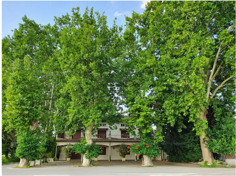
Nelle foto: sopra, alcuni platani; sotto, la Pasquetta vista da Dolfi, coi prodotti solidali appena acquistati