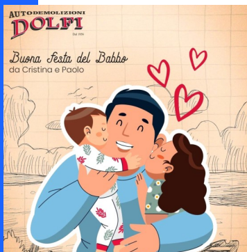
Nelle foto: a sinistra l'aiuto di Dolfi, a destra gli auguri a tutti i babbi